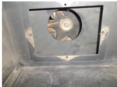
Vue intérieure : extracteur de fumée