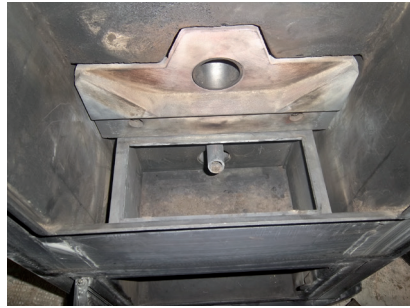
Vue intérieure sans le creuset : arrivée d'air, de granulé et bougie d'allumage

Il existe des contrats d'entretien vous permettant de programmer en toute confiance l'intervention de nettoyage par votre professionnel.