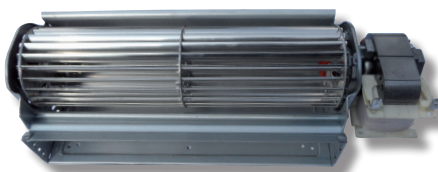
Exemple de ventilateur de convection tangentielle