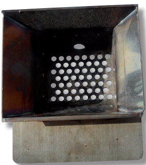
Exemple de creuset