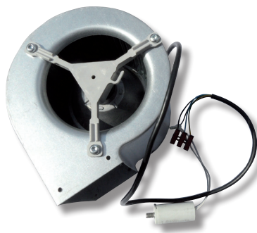
Exemple de ventilateur de convection centrifuge